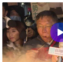
士林夜市水果攤坑人：華視影音